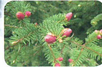
Nozioni sulle piante