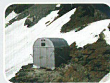
Biv. ORESTE BOSSI

Colle del Breuil 3.340 m - Cervino Bivacco incustodito - CAI Sez. Gallarate