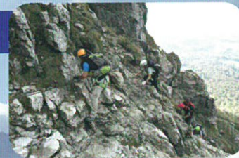
Percorsi attrezzati, ferrate