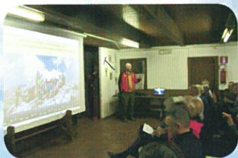
Lezioni in aula