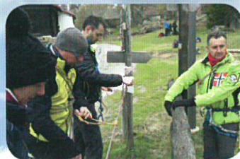
Uso dei nodi