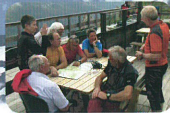
Permanenza al rifugio