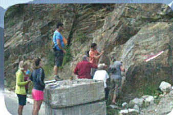
Nozioni sulle rocce