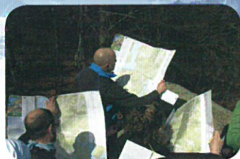
Letture delle cartine