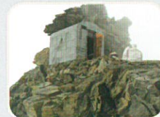
Biv. CITTÀ DI GALLARATE

Colle del Breuil 3.340 m - Cervino Bivacco incustodito - CAI Sez. Gallarate